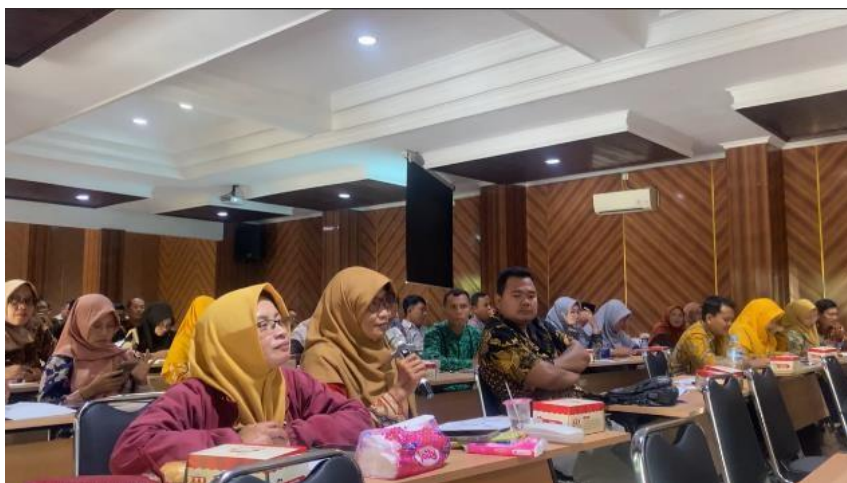
Gambar 2. Guru Bertanya tentang Modul Ajar Hipnoteaching