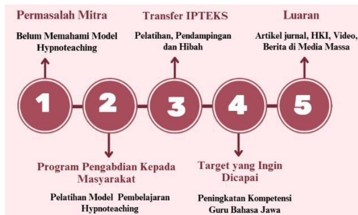
Diagram 1. Prosedur Kerja

Instrumen evaluasi yang digunakan dalam Program Pengabdian Kepada Masyarakat adalah sebagai berikut: (1) Observasi. Kegiatan observasi dilakukan dengan cara mengamati proses program pengabdian berlangsung, kemudian mencatat kendala-kendala, kekurangan-kekurangan, dan kelemahan-kelemahan yang muncul selama kegiatan tersebut; (2) Angket. Angket digunakan untuk mengetahui respon balik para guru terhadap materi pelatihan yang disampaikan oleh tim pengabdian; (3) Tes. Tes digunakan untuk menguji pemahaman mitra mengenai materi-materi pengabdian yang sudah diajarkan oleh tim pengabdian. Dari tes tersebut dapat diketahui apakah materinya dapat diserap mitra dengan baik atau tidak.