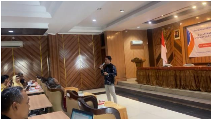
Gambar 1. Pemaparan Materi tentang Konsep Hipnoteaching