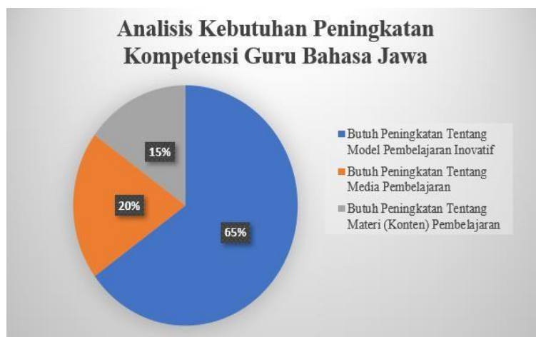
Grafik 1. Analisis Kebutuhan Guru Bahasa Jawa

Berdasarkan survey terhadap guru bahasa Jawa di Jawa Tengah, pemahaman guru terhadap model pembelajaran bahasa Jawa masih rendah. Mereka membutuhkan peningkatan kompetensi tentang model pembelajaran dibandingkan materi pelajaran maupun media pembelajaran. Berikut hasil survey kebutuhan peningkatan kompetensi guru bahasa Jawa di Jawa Tengah.